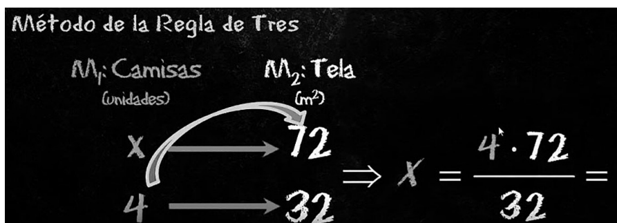
GRÁFICO 3. Captura de pantalla en el minuto 11:47. Método de la regla de tres.

(11:35) «Las magnitudes se colocan en forma de columna: ponemos x es a 72 como 4 camisas es a 32».