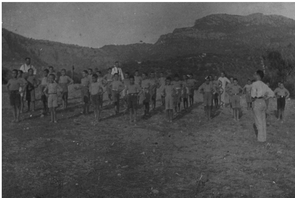
FOTOGRAFÍA 5: Colonos realizando ejercicios gimnásticos bajo la supervisión de diversos ayudantes, 1925 (AGCM).