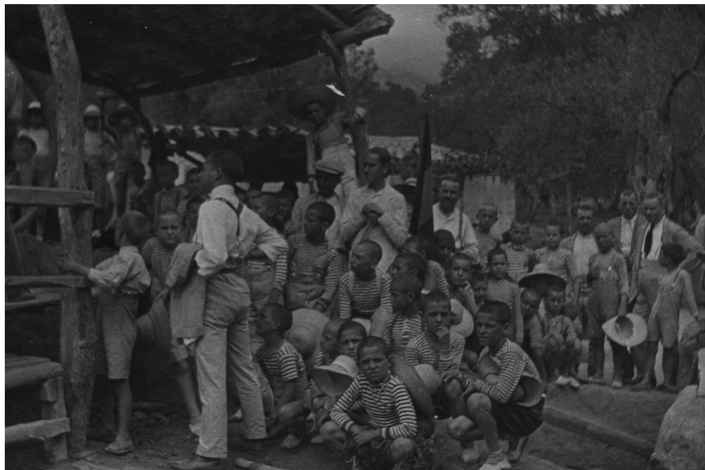
FOTOGRAFÍA 3: Excursión realizada a las minas de Buñola, 1925.