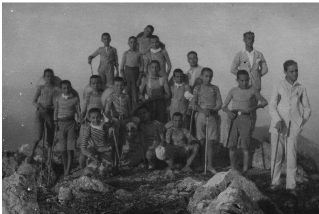
FOTOGRAFÍA 4: Excursión realizada al Puig Major, 1925 (AGCM).