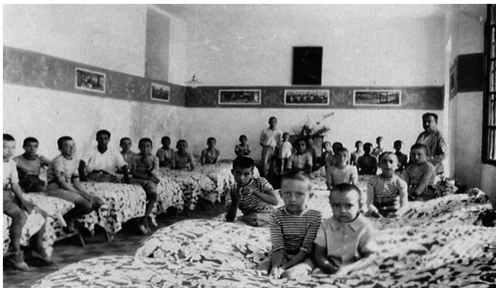
FOTOGRAFÍA 6: Los colonos en la sala-dormitorio, 1927.