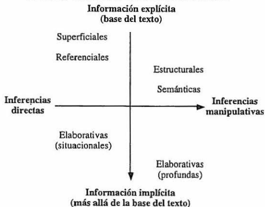
FIGURA 1: Clasificación de las inferencias lectoras

la interacción entre el texto y los conocimientos previos del lector. Este parámetro no resulta muy útil para clarificar las categorías en que podemos encuadrar las diferentes inferencias. En sentido estricto, aunque la mayoría de las inferencias profundas se realizan «hacia atrás», como consecuencia de la «detección de un problema de comprensión», también pueden iniciarse parcial e hipotéticamente «hacia adelante», como «predicción» que debe confirmarse al final de la lectura. La propuesta de clasificación de las inferencias que suscribimos aquí se fundamenta, más bien, en el papel que desempeñan en el proceso estratégico de la comprensión , así como en su nivel representacional . Este último depende básicamente tanto del grado de explicitación de la información textual, como del grado de complejidad de las operaciones cognitivas necesarias para inferirla. La combinación entre los criterios seleccionados (Figura 1) nos ofrece un punto de partida para delimitar la naturaleza de las inferencias «profundas» en el proceso de comprensión.